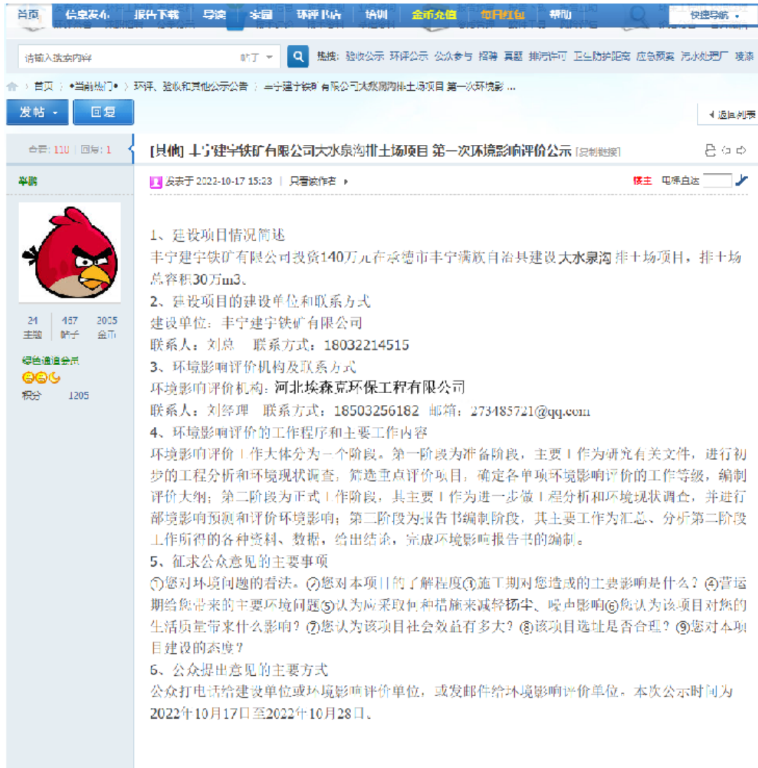
图1 第一次网上信息公示

我单位在网站上进行第一次信息公示，公示时间2022年10月17日至2022年10月28日，10个工作日，公示情况满足《环境影响评价公众参与办法》（生态环境部令[2018]第4号）要求，网上公示内容见图2。